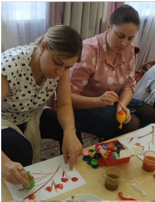
Рис. 1. Заседание клуба «Арт-мастер»