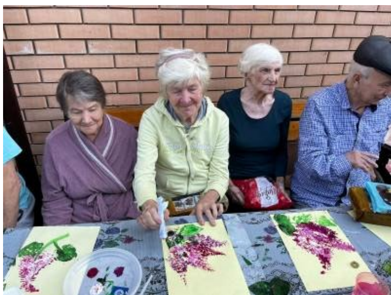
Рис. 6. Творческая встреча в пансионате «Добро»