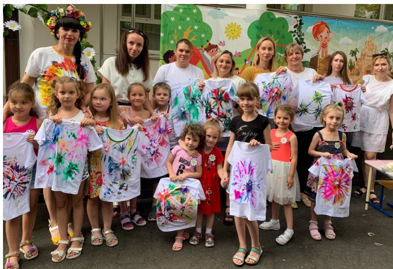
Рис. 12. Техника росписи ткани «Тай-дай. Завяжи и покрась»