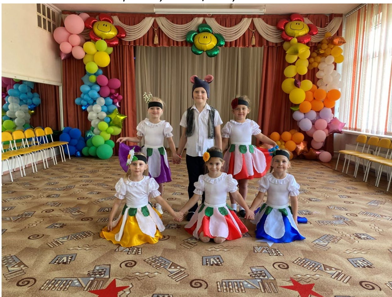
Театрализованная постановка «Лесная история»