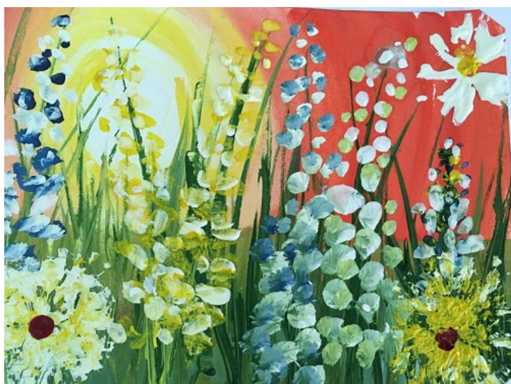
Рис. 4. Печать коктейльной трубочкой и пальчиками