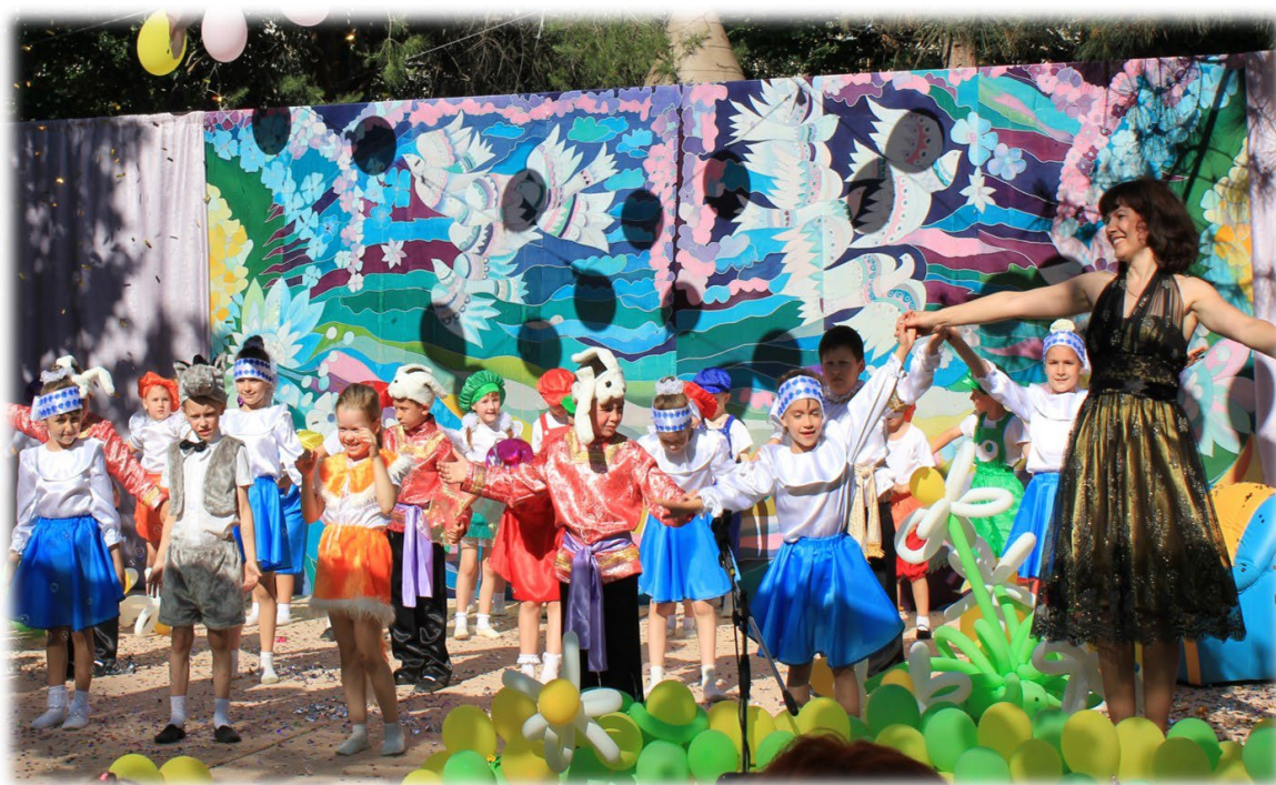
Авторская сказка «Как избушка стала дворцом»

Успешность решения поставленных задач зависит от позиции администрации и каждого педагога (специалиста), их возможности включиться в инновационную деятельность. Это позволяет сохранить динамику развития МАДОУ как многовариативной, разноуровневой, лично - ориентированной образовательной системы.