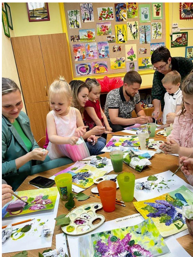
Рис. 10. Вечер семейного рисования