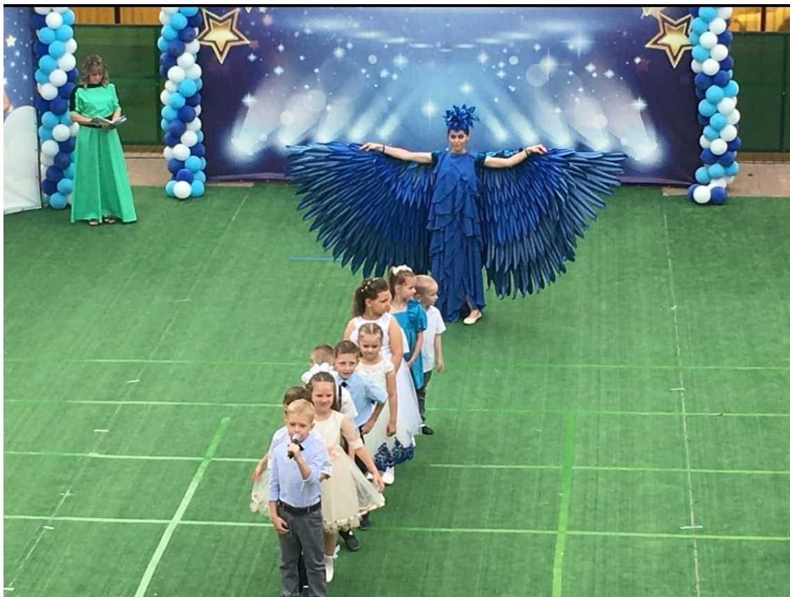
Выпускной бал. Финальная песня «До свидания, детский сад»

Дети выступают в качестве ведущих, самостоятельно проводят мероприятия в детском саду, умеют пользоваться микрофонами, не «теряются на сцене».