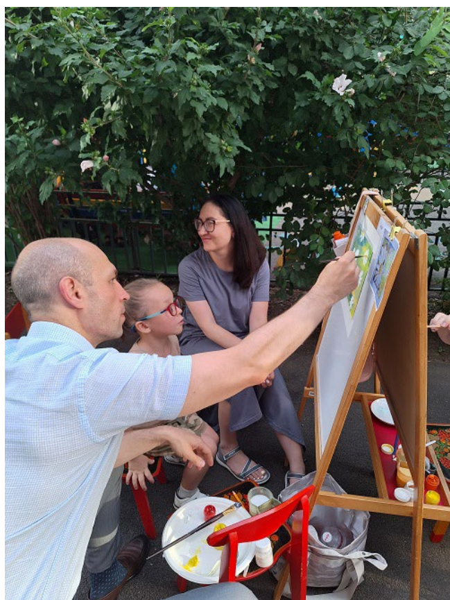
Рис. 11. Праздничный пенэр