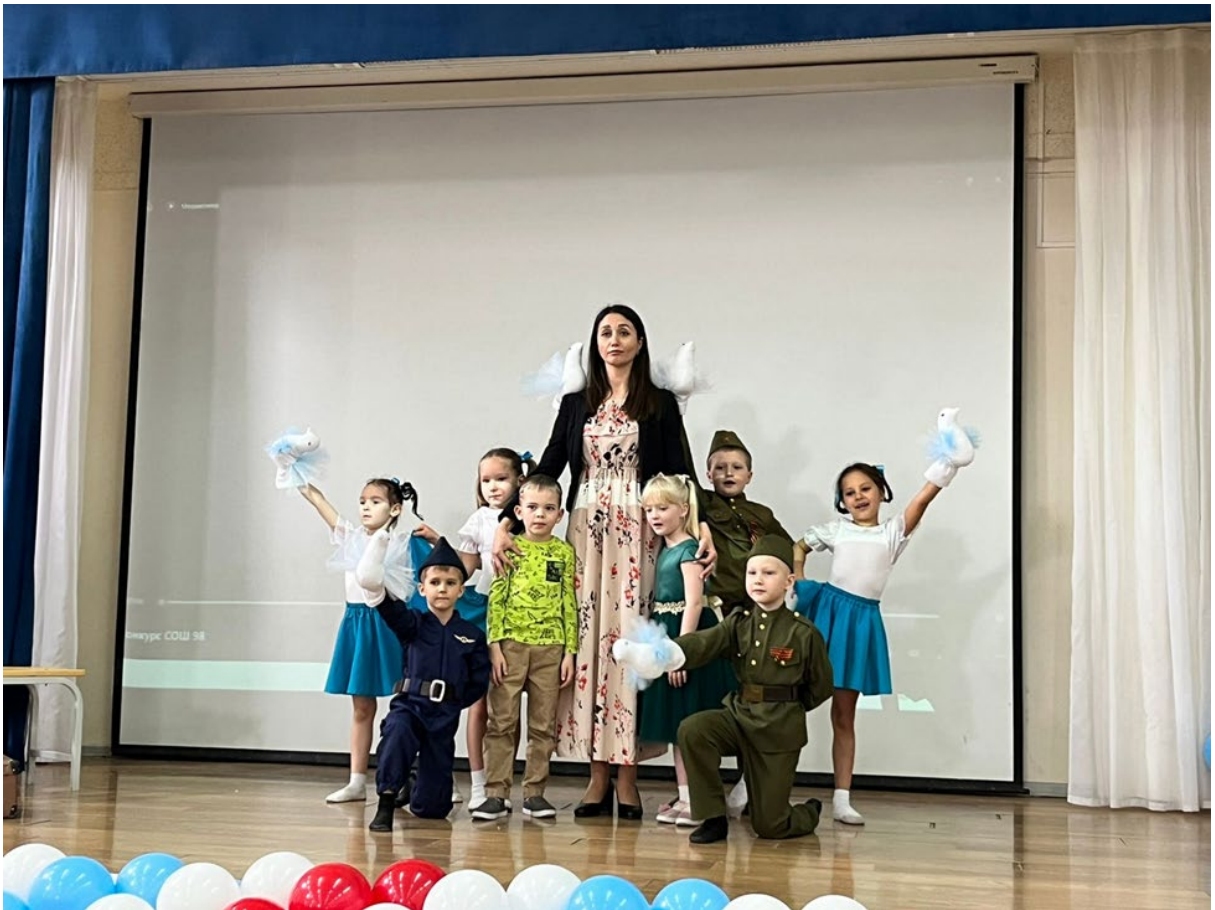
Фестиваль-конкурс «Наследники Победы»

Наш коллектив полон новых творческих идей и замыслов, а дети с интересом ждут новых сказок. Дети всегда готовы играть сказки. Это их способ познания мира. Хорошая сказка радует детей своим оптимизмом, любовью ко всему живому, мудрой ясностью в понимании жизни, сочувствием к слабому, лукавством и юмором. Ребёнок, входя в сказку, получает роль одного из героев, приобщается к культуре своего народа, непроизвольно впитывает в себя то отношение к миру, которое даёт силу и стойкость в будущей жизни.