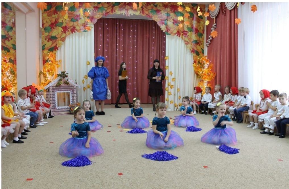
Осенний утренник. Танец «Тучка»

Занятия хореографией также включают в себя комплекс упражнений и практик, которые реализуются весь период нахождения ребенка в саду. Для занятий хореографией у детей имеется специальная форма и обувь, что отвечает эстетическим требованиям.