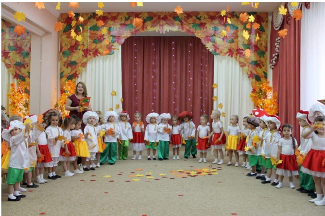
Осенний утренник. Исполнение песни «Осень золотая»

Во всех группах проводится полноценная вокально – хоровая работа, согласно возрастным особенностям детей: