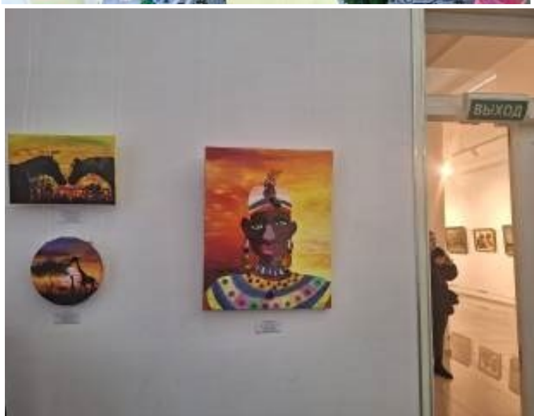
Рис. 7. Выставка работ детей в музее Ф.А.Коваленко