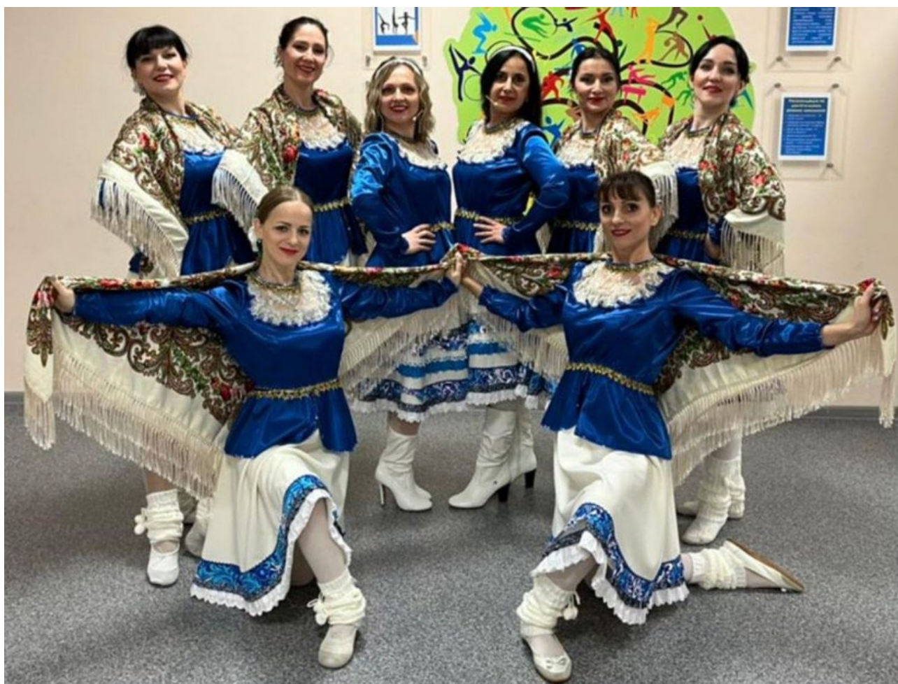
Творческий коллектив МАДОУ «Бархатные тени»

Очень важно, что наш коллектив не просто танцует на мероприятиях, педагоги - авторы постановок, авторы проектов, мероприятий не только садовского, но и городского и краевого уровней.