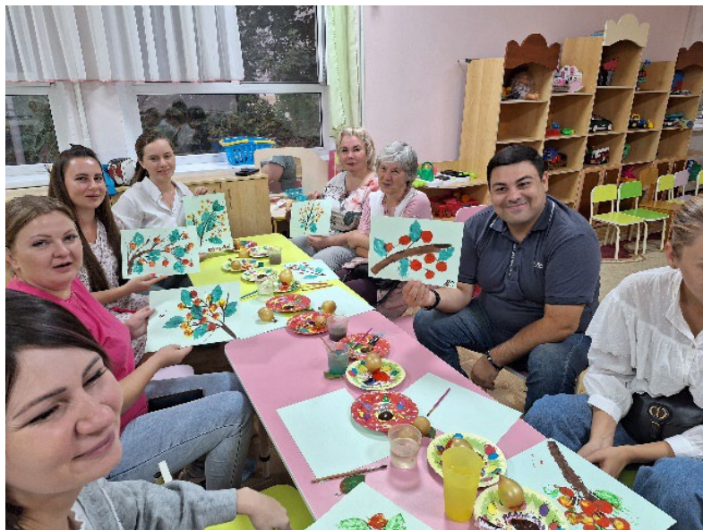
Рис. 8. Родительское собрание с творческим погружением