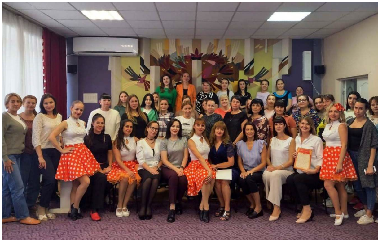
Коллектив МАДОУ МО г. Краснодар «Детский сад № 221»

Особенно хочется отметить кадровые условия. Коллектив МАДОУ МО г. Краснодар «Детский сад № 221» - большой, очень разный по возрастному составу, по опыту, по интересам. И огромная заслуга руководителя в том, чтобы заинтересовать, поддержать, сплотить таких разных педагогов в достижении поставленных целей.