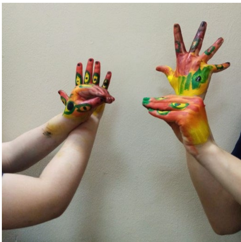
Рис. 9. Театр «Умные руки»