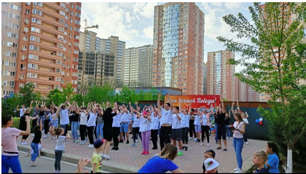
Флэш-моб для всей семьи

Вся семья преодолевает эстафеты на спортивных мероприятиях, переодевается в костюмы разных народов на День Народного Единства, принимает участие в приготовлении национальных блюд, оформлении фотозоны и подготовке творческих номеров и поделок от каждой группы на осенней ярмарке.