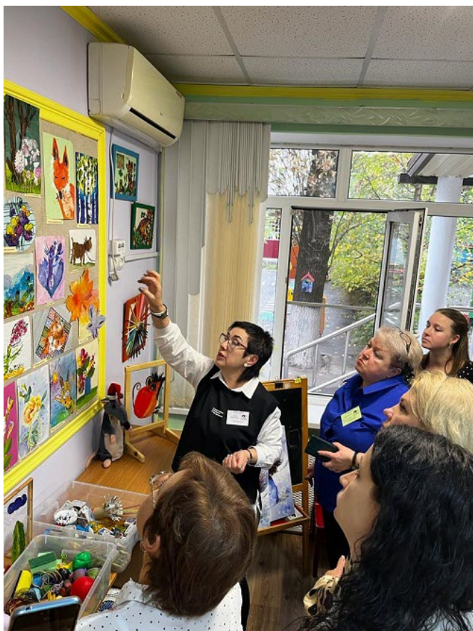
Рис. 3. Студия «Арт-личность»