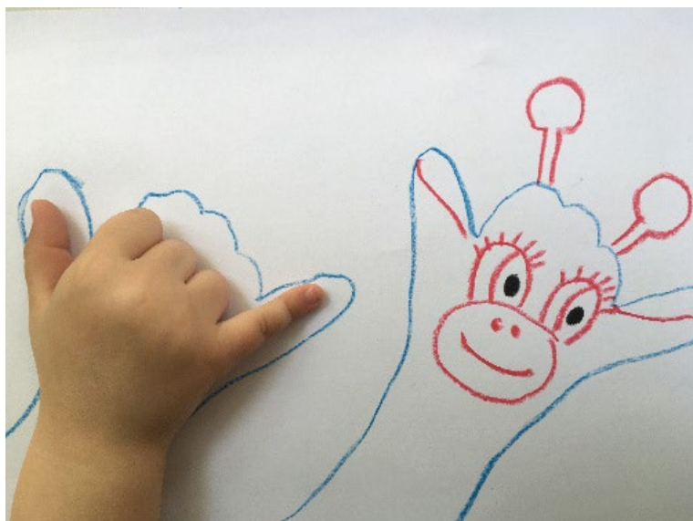
Рис. 5. Рисование умными ручками