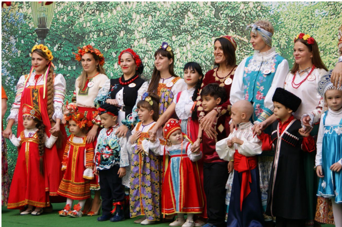
Участие родителей в проектной деятельности.

Включение родителей (семьи) в инновационную деятельность МАДОУ МО г. Краснодар «Детский сад № 221» происходит через их погружение в образовательное пространство через разнообразные ситуации взаимодействия, выстраивание партнерских отношений в образовании. И мы видим, как меняется позиция родителей: от зрителя к активному участнику, партнёру.