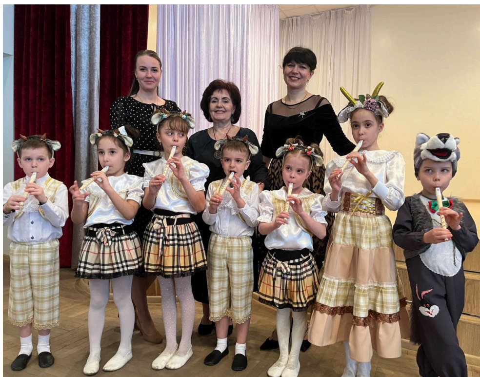
Фестиваль «Поёт свирель»

Воспитанники и педагоги МАДОУ активно участвуют в творческих, интеллектуальных профессиональных конкурсах разного уровня (муниципального, краевого, федерального, международного). Что способствует эффективному всестороннему развитию детей, повышению профессиональной компетенции педагогов.