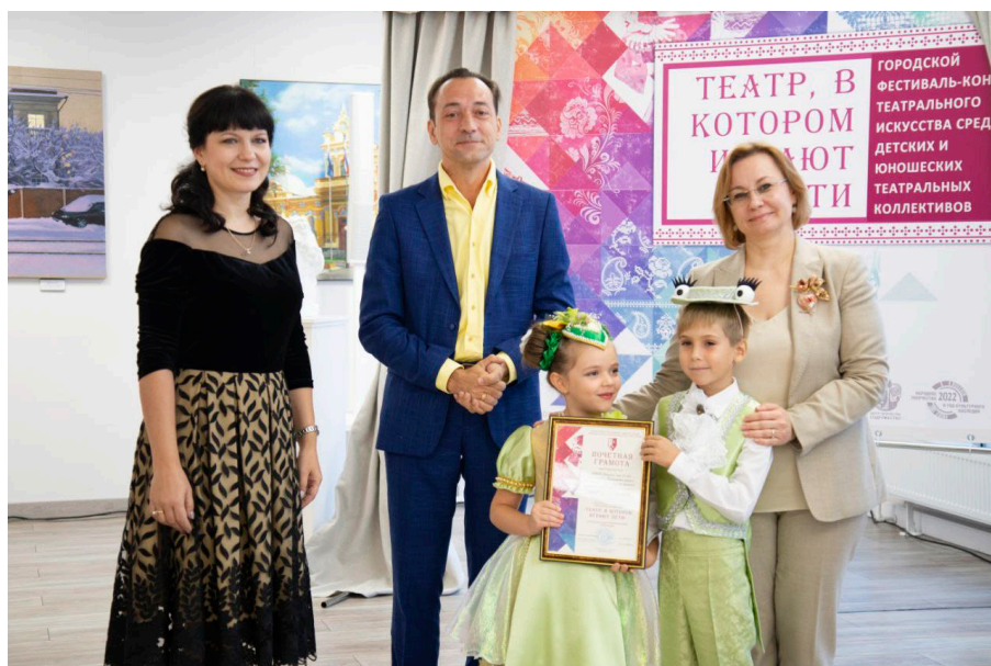
Конкурс «Театр, в котором играют дети»