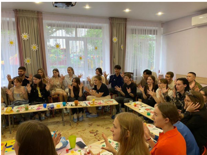
Рис. 2. Семинар для студентов КубГУ