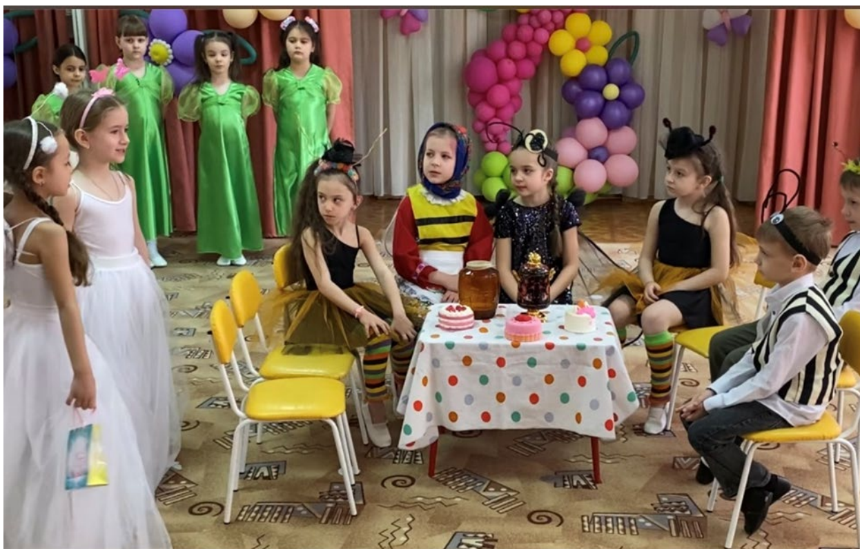
Опера «Муха – Цокотуха»